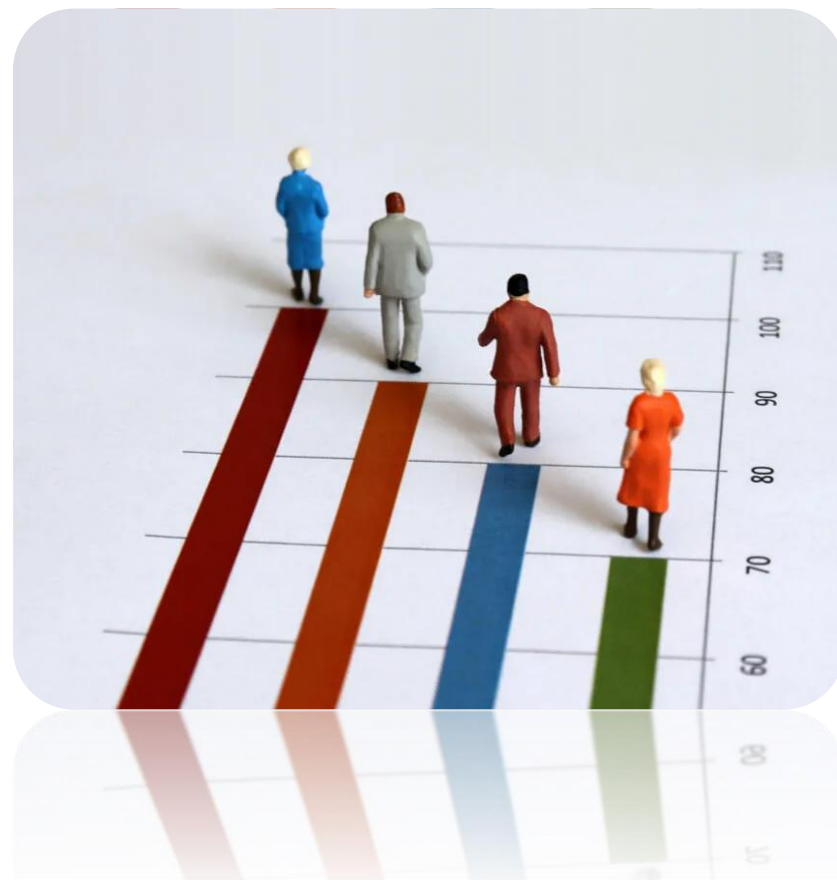
Численность населения Швеции