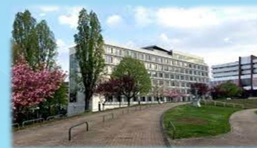
Институт Европейского омбудсмена