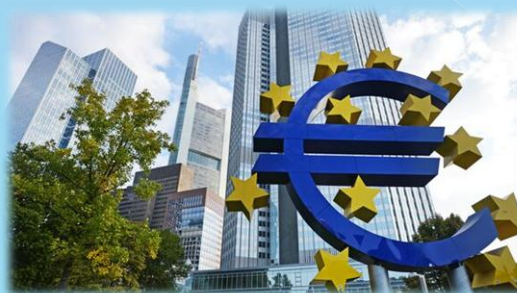
Европейский Центральный Банк