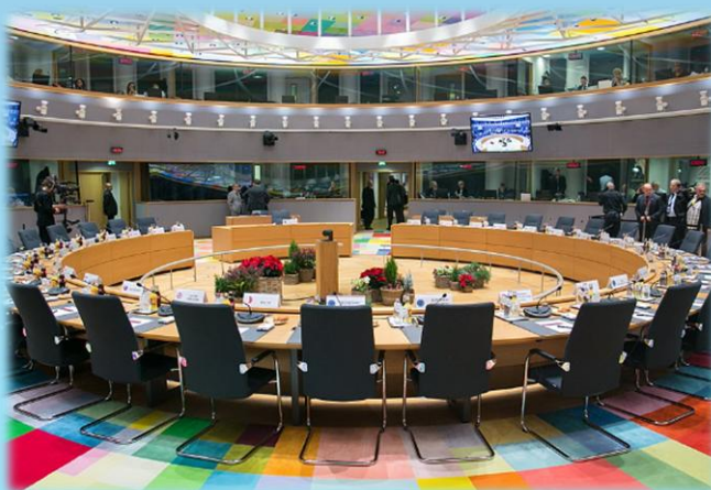
Совет Европейского Союза